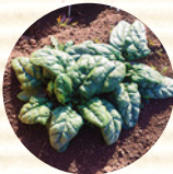
ちぢみほうれん草